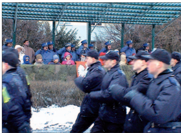
ZESPÓŁ PRASOWY Pożegnano funkcjonariuszy, którzy skończyli służbę w oddziale prewencji.

i w tak złożonych operacjach, jak zabezpieczenie Europejskiego Szczytu Gospodarczego. Młodzi chłopcy zaznaczyli swoją obecność nie tylko patrolując ulice miasta. 65 z nich pomogło warszawiakom oddając swoją krew. Oddano aż 82 litry krwi. Wśród odchodzących do cywila funkcjonariuszy, kilkudziesięciu zostało wyróżnionych nagrodami pieniężnymi oraz podziękowaniami od Komendanta Stołecznego Policji.