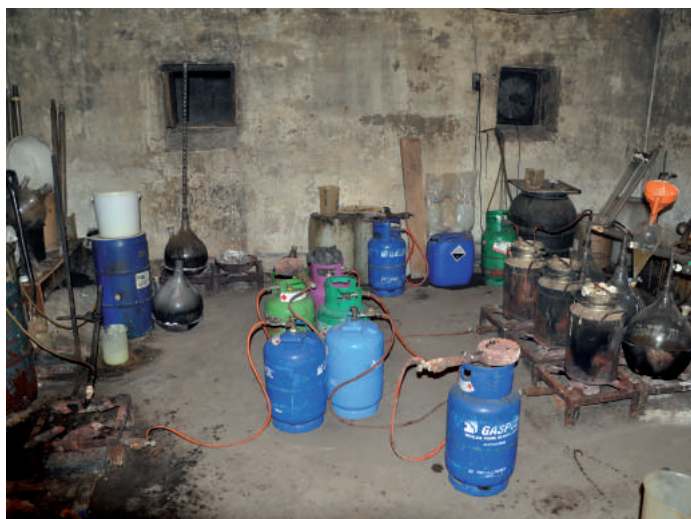
■ Likwidacja nielegalnego laboratorium w Starych Grabiach pod Wołominem w 2013 r.