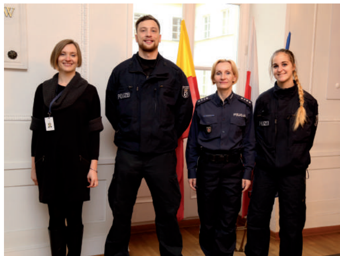
■ Policjanci z Berlina wraz z opiekunami z KSP

czeń. Podsumowując swoją wizytę w garnizonie stołecznym podkreślali profesjonalizm działania stołecznych policjantów oraz wyraźny zakres zadań. Nie zauważyli większych różnic w wyposażeniu, ale dziwili się, że w odróżnieniu do berlińskich funkcjonariuszy stołeczni policjanci nie zakładają w czasie pieszego patrolu kamizelek kuloodpornych. Byli pod wrażeniem nowoczesnego monitoringu miejskiego, dającego szereg możliwości i ułatwiającego pracę służb porządkowych. Zachwycali się polską gościnnością i przyjaźnią okazywaną im przez stołecznych policjantów na każdym kroku. Wizyta berlińskich policjantów pozwoliła na wymianę doświadczeń w zakresie policyjnej służby w obu krajach i szeroko pojętego bezpieczeństwa. ■