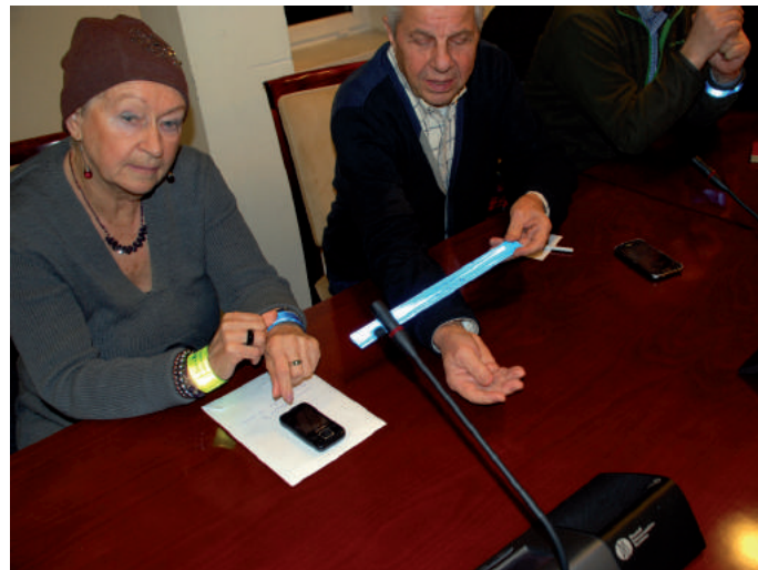
■ Spotkanie z seniorami w Powiecie Warszawskim Zachodnim

zbliżających się do tego wieku. Podczas organizowanych spotkań funkcjonariusze przypominają o właściwych zachowaniach oraz o niebezpieczeństwach występujących w ruchu drogowym. ■