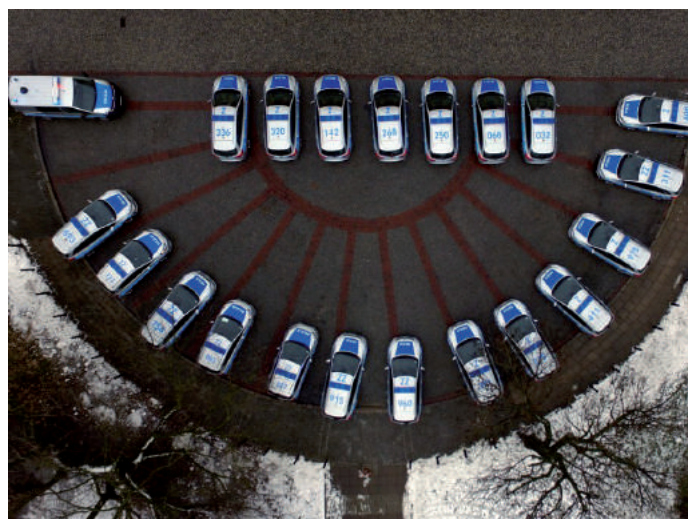
■ Zdjęcia z uroczystości (nr 2 i 3 wykonane po raz pierwszy w historii stołecznej Policji z drona)