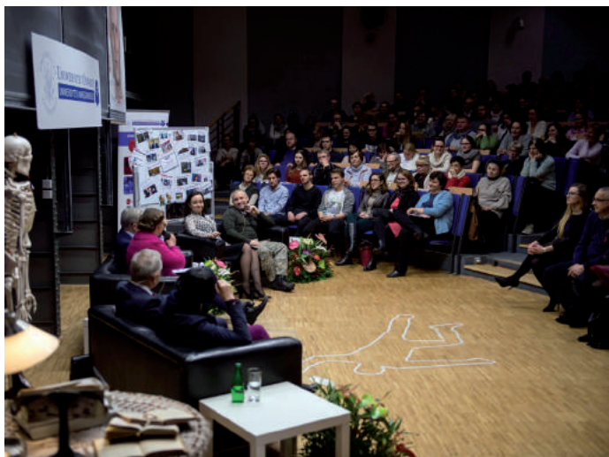
■ Debata Uniwersytetu Otwartego UW w Auli Starej Biblioteki Uniwersytetu Warszawskiego.

zorganizowanych grup przestępczych. Znając codzienne realia pracy Policji i świata przestępczego, chętnie więc sięga po kryminały, ale tylko te maksymalnie realistyczne, np. „Black Out” czy „Zero” Marca Elsberga. Scenariusz, według którego za chwilę jakaś organizacja terrorystyczna może globalnie odciąć zasilanie energią, staje się bardzo realny, wyzwala w czytelniku potrzebę myślenia, wybiegania naprzód, zastanowienia się, czy mamy procedury, czy jesteśmy gotowi zmierzyć się z takim zagrożeniem.