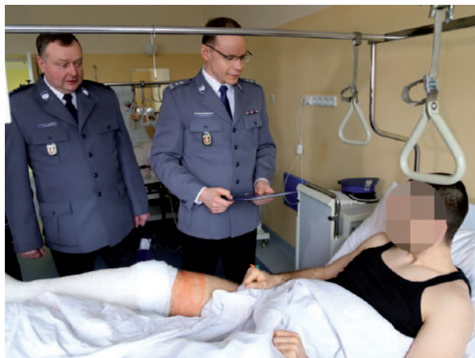
■ Komendanci podczas odwiedzin w szpitalu u ранnego policjanta