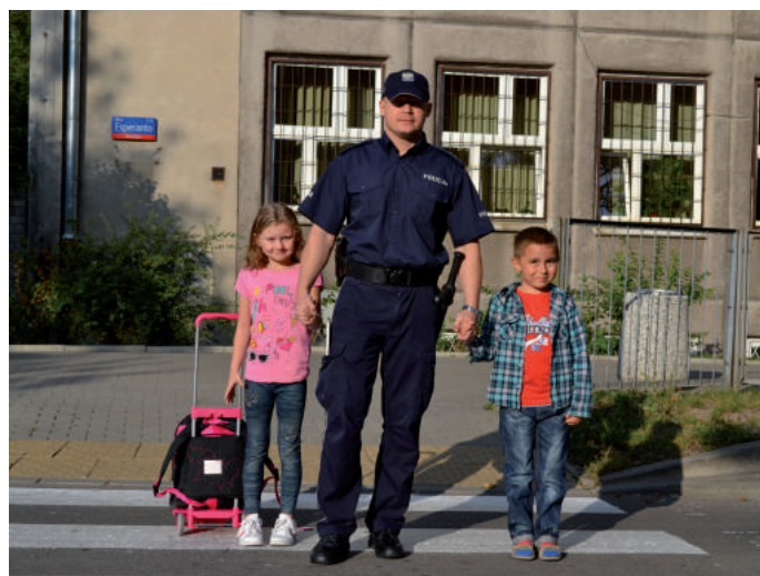
■ Policjant z dziećmi w drodze ze szkoły