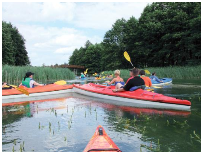
■ Członkowie IPA podczas spływu kajakowego