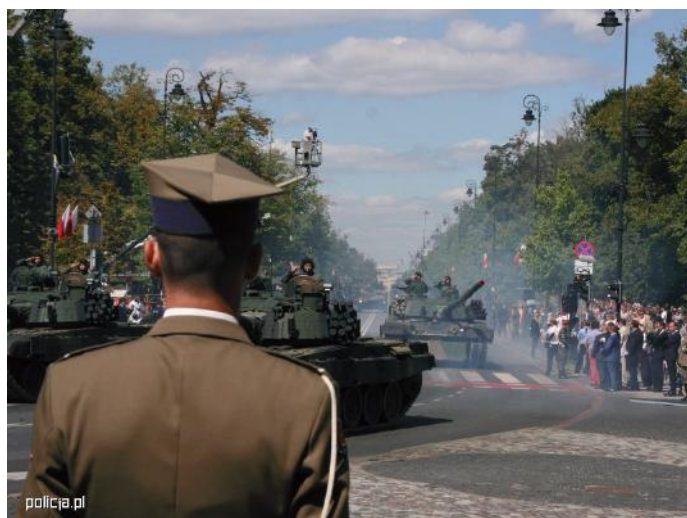
■ Święto Wojska Polskiego w Warszawie