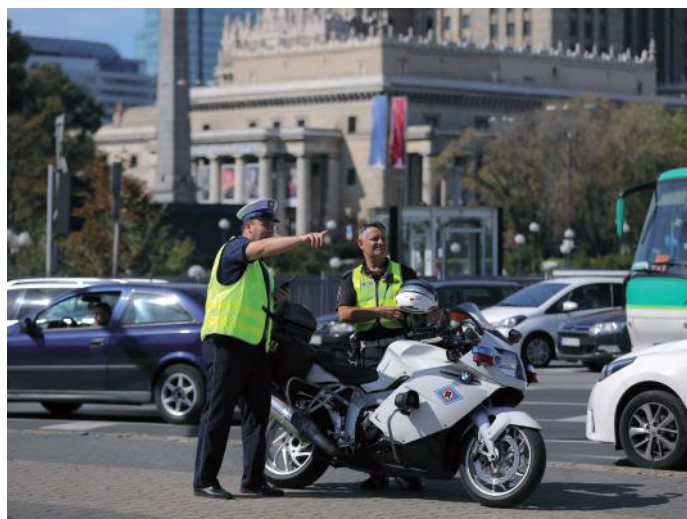
■ Policjanci z „drogówki” dziś