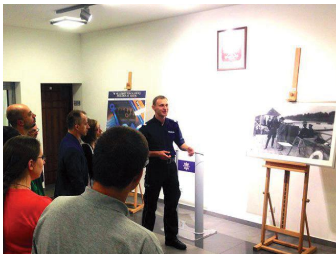
■ Policjant opowiada historię „wodniaków”

garni. Zwiedzający z uwagą oglądali: mundury policji wodnej z różnych okresów, sprzęt ratowniczy, łodzie, silniki, zarekwirowany sprzęt kłusowniczy, urządzenia do obserwacji terenu w trudnych warunkach oraz „skarby”- artefakty z okresu „potopu szwedzkiego” wyłowione z Wisły w latach 2011-2016. Nie zabrakło informacji o specyfice pracy funkcjonariuszy i działalności edukacyjno-profilaktycznej. Największe zainteresowanie budziła część dotycząca historii i działalności funkcjonariuszy komisariatów rzecznych Policji Państwowej w II RP, a serca i umysły rozpałały opowieści o próbach samobójczych i akcjach ratowniczych nad Wisłą. ■