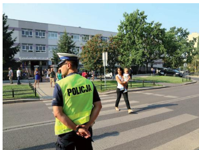
■ Ogólnopolska akcja policyjna „Bezpieczna droga do szkoły”